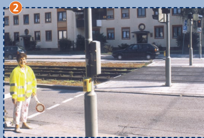
Siglstraße/Ludwig-Richter-Straße (Vorsicht Trambahn!)